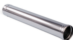
Rallonge cheminée inox L 1m