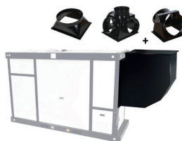
Adaptateur sortie d'air 90°