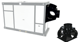
Tête de soufflage 4 voies