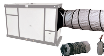
Gaine flexible 6 m avec clip