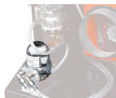
Kit filtre de dégazage

ø700 - L 6m - Code : sur demande Collier de serrage (ø400-750) Code : 223 4262