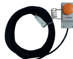
Thermostat TPGF -5/+50°C 10 m - Prise 90°