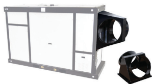
Tête de soufflage 2 voies