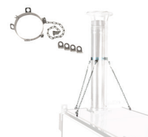
Kit support cheminée