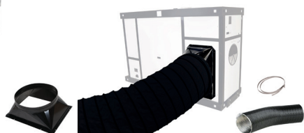
Gaine renforcée entrée d'air

ø700 - L 6m - Code : sur demande Collier de serrage (ø400-750) Code : 223 4262