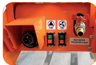
Prise industrielle 16 A 2P+T Type CEE Embout cannelé DM20