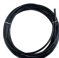
Tuyau souple haute pression