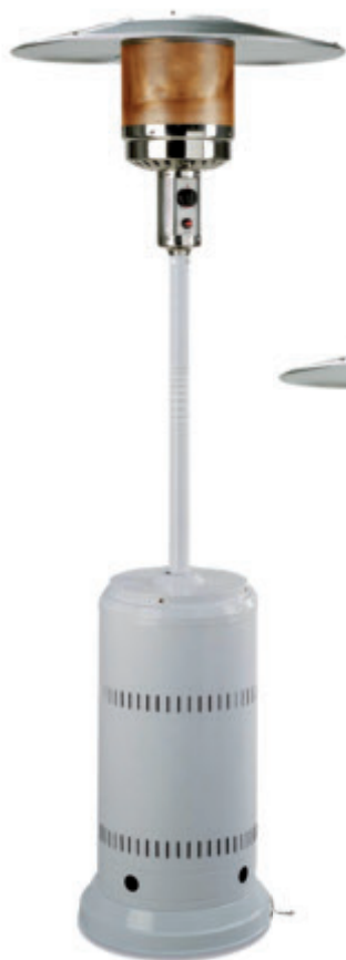
PC 12 B