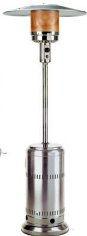
PC 12 I