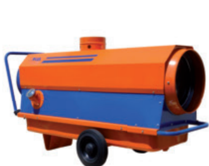
GF 25.3 AC