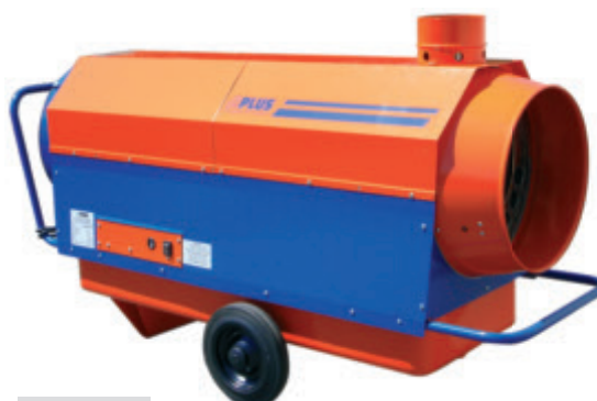
GF 45.1 AC